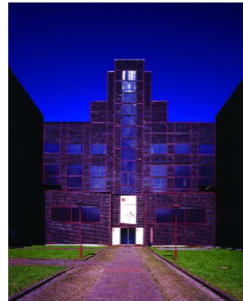
red dot design museum Essen

Intellectual property rights We recommend that all participants check whether the submitted concepts or product ideas, including their design and any inventions associated with them, are legally protected or should be legally protected. When the products are made public as part of the competition, they and any inventions associated with them, lose their "novelty". This means that intellectual property right applications, which are made afterwards, will only be possible at a restricted level or within certain deadlines. Where required, we will be pleased to put you in touch with specialist law firms, which will provide you with information.