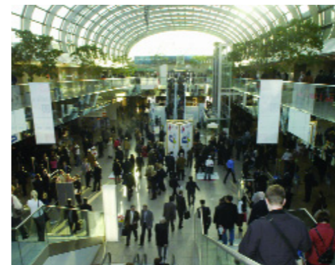
Düsseldorf fair ground